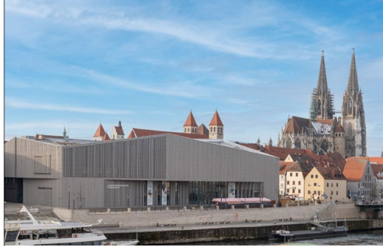
▲ HAUS DER BAYERISCHEN GESCHICHTE AM DONAUMARKT IN REGENSBURG Schauplatz der Bayerischen Landesaussstellung

Regensburg | Haus der Bayerischen Geschichte Dienstag bis Sonntag 9 – 18 Uhr | www.hdbg.de