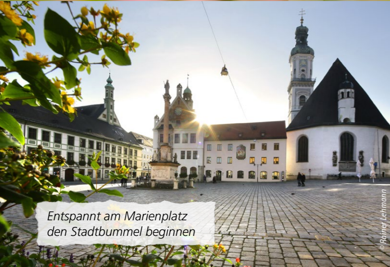
Entspannt am Marienplatz den Stadtbummel beginnen