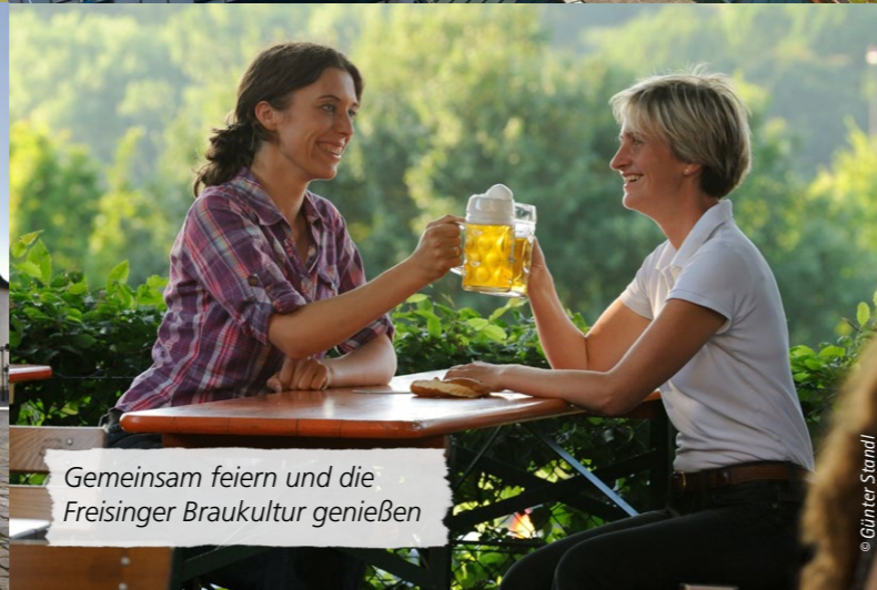
Gemeinsam feiern und die Freisinger Braukultur genießen