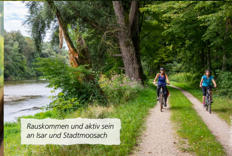
Rauskommen und aktiv sein an Isar und Stadtmoosach