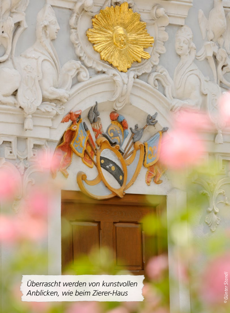
Überrascht werden von kunstvollen Anblicken, wie beim Zierer-Haus