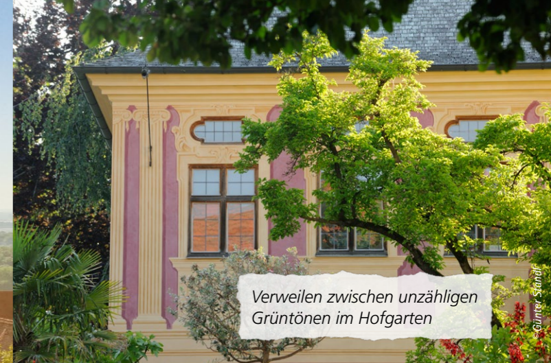
Verweilen zwischen unzähligen Grüntönen im Hofgarten