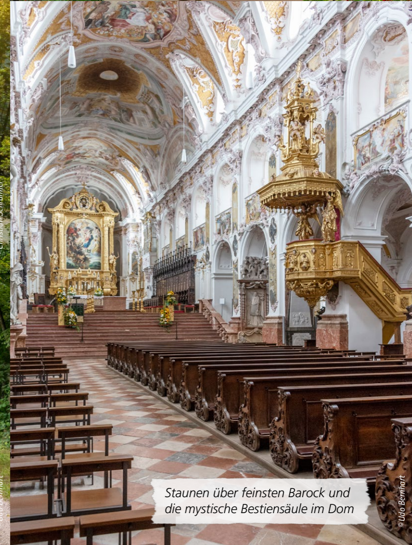
Staunen über feinsten Barock und die mystische Bestiensäule im Dom