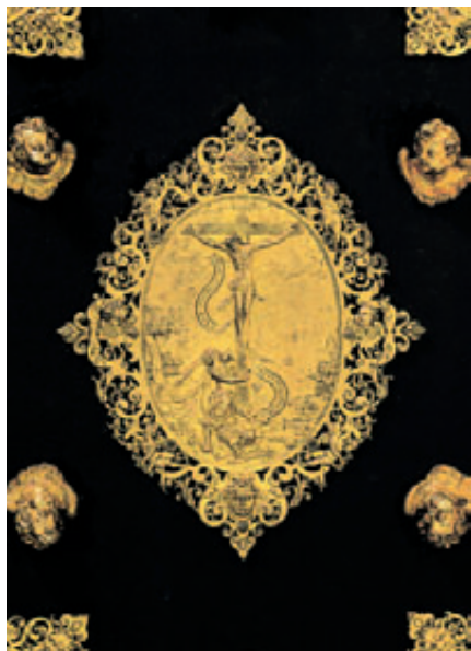
Vordereinband - Mittlerer Beschlag mit Kreuzigungsszene

Das Große Tucherbuch übertrifft in Form und Inhalt alle übrigen Nürnberger Patriziergenealogien und wäre in seiner reichen Ausstat-