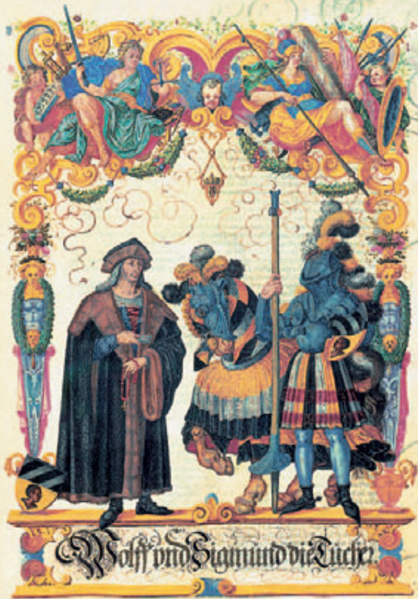
fol. 27 r Wolf und Sigmund Tucher als „legendäre Ahnen“ der Tucher