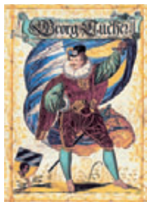
fol. 62 v · fol. 69 v · fol. 141 v · Beispiele „kleinerer“ Miniaturen