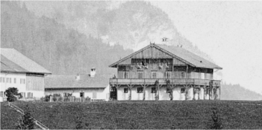
Ein Forsthaus erkennt man in Bayern in der Regel schon von weitem an dem über dem Eingang angebrachten Hirschgeweih, das man als Symbol für die enge Verbindung von Jagd und Forst, Wald und Wild deuten kann. Das Forsthaus in der Vorderriß erfüllt diese Assoziation gleich mehrfach: Es war herzogliches und königliches Jagdhaus, Dienstsitz des Revierförsters Thoma und der Schauplatz für die Lausbubengeschichten des Ludwig Thoma.

musste organisatorisch bewältigt werden. Tatsächlich verringerten sich die umfangreichen Waldflächen jedoch, noch bevor sie als Staatswald bewirtschaftet wurden: Im Zuge einer „Purifikation“ wurden großzügig Forstrechte im (neuen) Staatswald gegen Waldeigentum getauscht. Im ganzen Königreich entstanden kleine Bauernwaldparzellen, die noch heute sichtbar den großen Staatswäldern vorgelagert sind.