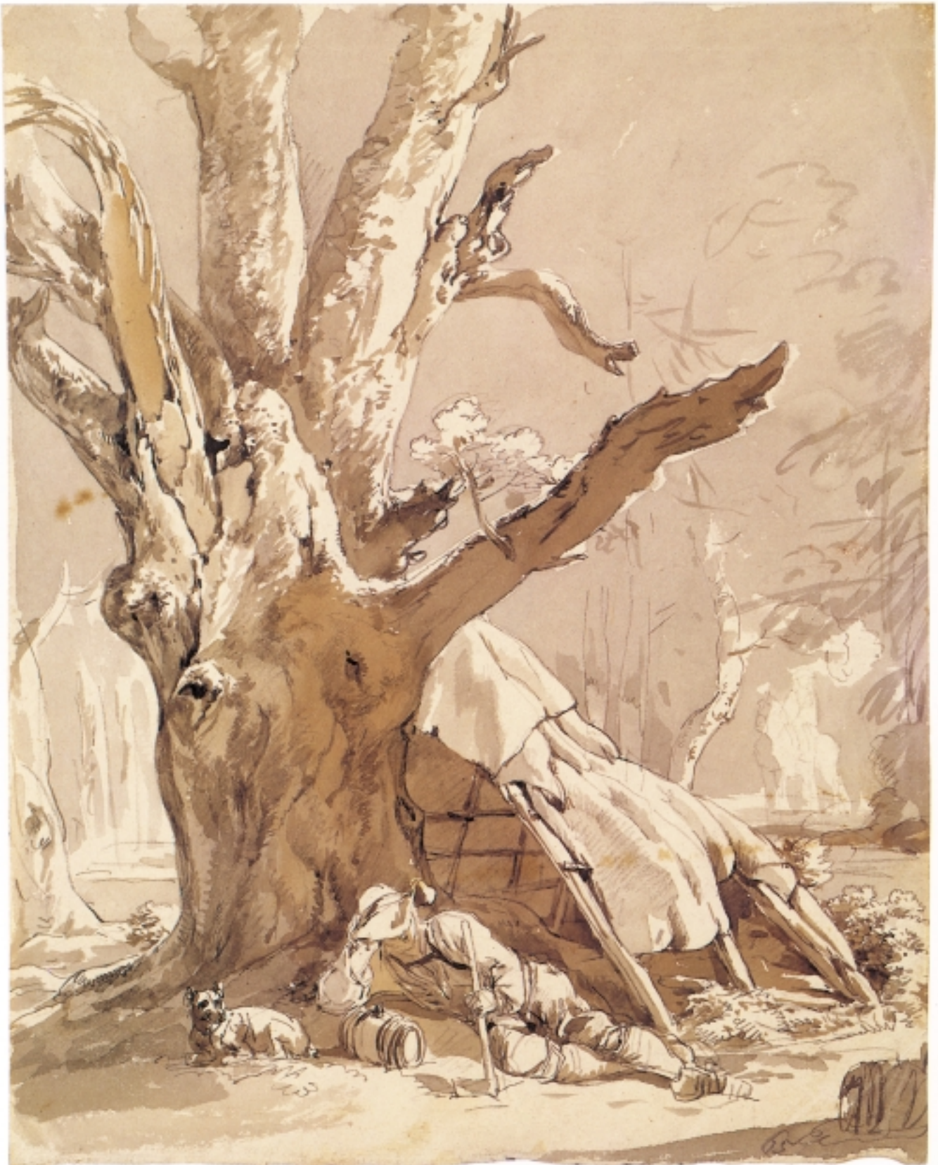
Der Waldarbeiter, den Johann Georg von Dillis in seiner Zeichnung von 1865 verewigt, ruht sich, mit der Axt in der Hand, vor seinem provisorischen Kobel aus. Dillis, der selbst aus einer Försterfamilie stammte, war mit den Gegebenheiten von Wald und Forst wohlvertraut. Jenseits ihrer künstlerischen Bedeutung gibt seine Zeichnung den Zustand vieler Wälder in der Mitte des 19. Jahrhunderts wieder: einzelne Bäume in einem ausgeplünderten, savannenartigen Wald. Das aus der Dillis-Sammlung des Historischen Vereins von Oberbayern stammende Bild wird heute in der Städtischen Galerie im Lenbachhaus, München, aufbewahrt.