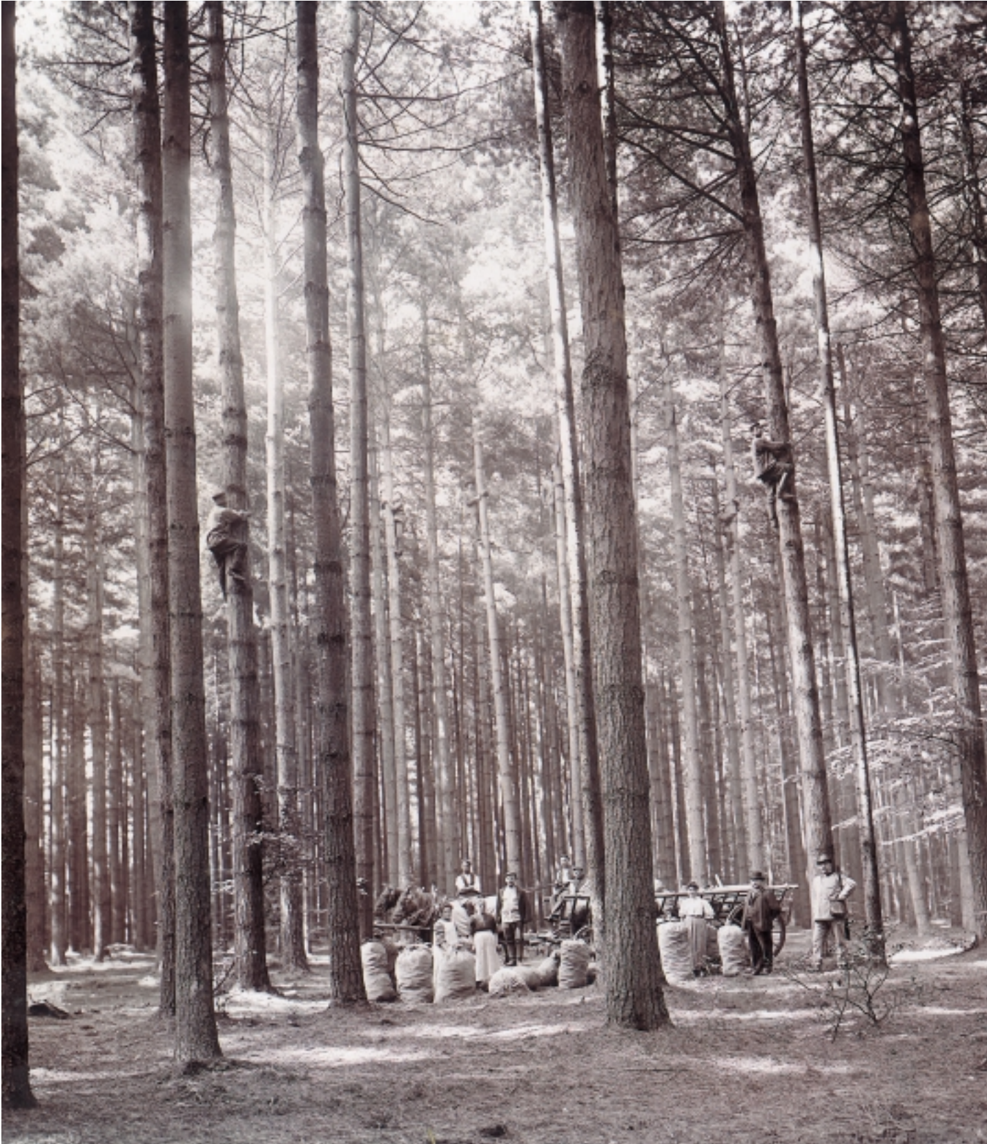
Wie vielfältig und „ertragreich“ die Wälder noch bis weit in das 20. Jahrhundert genutzt wurden, ist dem Pilze sammelnden Spaziergänger heute kaum bewusst. In wertvollen Waldbeständen, hier mit der Weymouthkiefer oder Strobe, wurden die Samen geerntet, in Klengen getrocknet, gereinigt und anschließend in den Handel gebracht. Die Fotografie von 1909 zeigt die Mitarbeiter der Miltenberger Klenganstalt bei ihrer Arbeit auf dem Boden und in luftiger Höhe; rechts wohl der Firmenbesitzer, begleitet von einem Förster. Auch heute spielt die Saatguternte in zugelassenen Beständen eine bedeutende Rolle für die Gewinnung von herkunftsgesichertem Pflanzenmaterial.